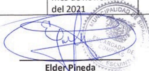
Elder Pineda Encargado de Compras